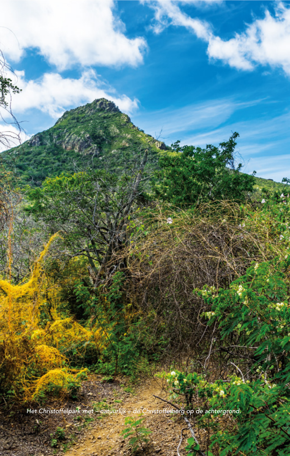
Het Christoffelpark met – natuurlijk – de Christoffelberg op de achtergrond.